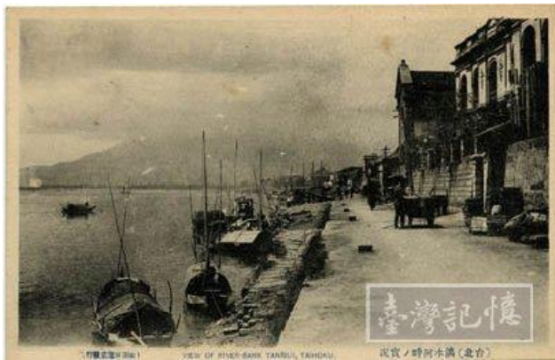
圖 3 台北淡水河畔。為日治時期發行之明信片，發行時間約為 1910 年。

英人杜德有計劃地開創茶葉種植與銷售，不僅成功促成台灣茶葉外銷全球，也帶動大稻埕的經濟結構重組，1865-1875 杜德來台年間，已有德記、寶順、水陸、和記和怡和等五家洋行經營茶行。大稻埕成為國際上重要的茶葉出口區。